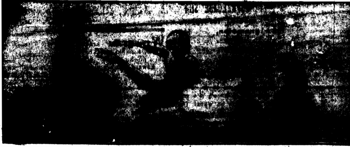
W pochmurny dzień blisko prawdziwej wulkanicy morza szałka wrzedeł w kancyjnie i szponielak.