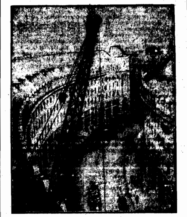
Oświetlenie kranu, który pracuje przy budowie wielkiego domu towarowego w Londynie.