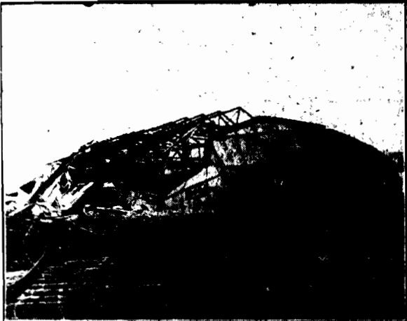
Zgrupowane składy amunicyjne w Lake Denmark.